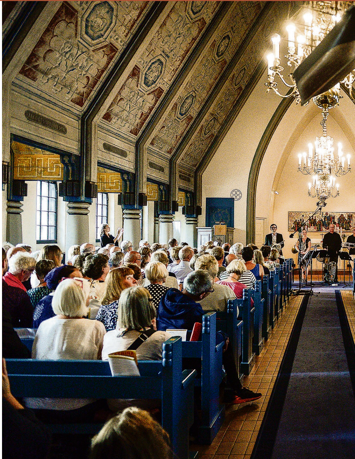
I tisdags gick den 20:e Katrinafestivalen av stapeln. Öppningskonserten hölls i en fullpackad S:t Görans kyrka.