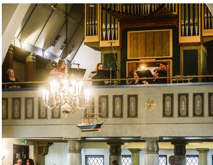
Från läktaren hör man toner från stråkar, orgelns luftiga andning och sopranen Sofie Asplunds outtröttliga vibrato.

Kompositionen som går i 9/8 och är ökad för sitt flitiga användande av tempo rubato, gör