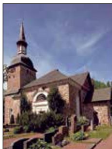
Jomala kyrka Godbyvägen 445 Jomala