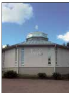
Ålands musikinstitut Grindmattesvägen 7 Mariehamn