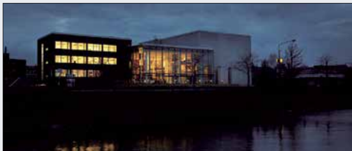
Alandica kultur och kongress Strandgatan 33 Mariehamn