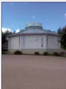
Ålands musikinstitut Grindmattesvägen 7 Mariehamn