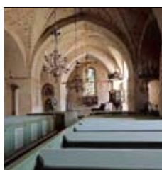
St Mikael's kyrka Pålsbölevägen Finström