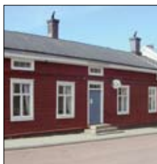
Bagarstugan Café & Vin Ekonomiegatan 2 Mariehamn