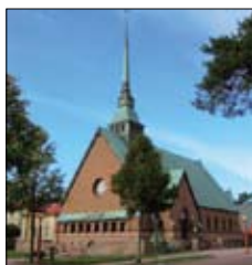
St Görans kyrka Ö. Esplanadgatan 6 Mariehamn www.mariehamn.evl.ax