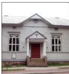
Missionskyrkan Storagatan 10 Mariehamn www.missionskyrkan.ax