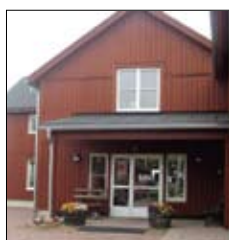
Hantverkshuset SALT Sjökvarteret Mariehamn www.salt.ax