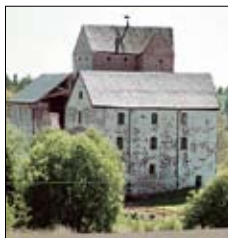
Kastelholms slott Kastelholm Sund