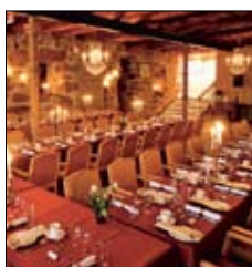
Ulfby gård Ulfbyvägen 53 Jomala www.ulfby.ax