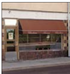
Amorina Chocolaterie Strandgatan 8 Mariehamn www.amorina.ax