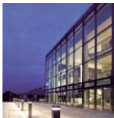
Alandica kultur & kongress Strandgatan 29 Mariehamn www.alandica.ax