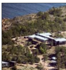
Havsvidden Havsviddsvägen 90 Geta www.havsvidden.ax