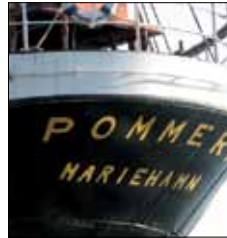
Museifartyget Pommern Västerhamn Mariehamn