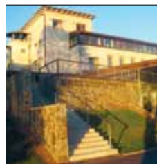
Ålands sjöfartsmuseum Hamngatan 2 Mariehamn