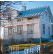
Hemma-hos Tomtebo, Vårdöby Vårdö