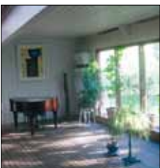
Hemma-hos Tvärgränd 6 Mariehamn