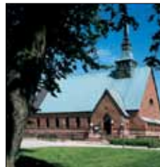
S:t Görans kyrka Ö. Esplanadgatan 6 Mariehamn