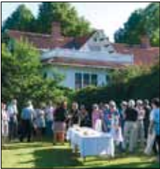
GE-villans trädgård N. Esplanadgatan 5 Mariehamn