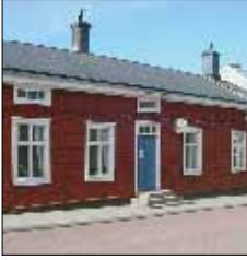
Bagarstugan Café & Vin Ekonomiegatan 2 Mariehamn