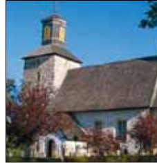
Lemlands kyrka Lemlandsv. 1328 Lemland