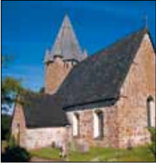
Finströms kyrka Pålsbölevägen Finström