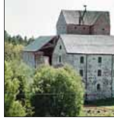
Kastelholm slott Kungsgårdsallén 5 kastelholm Sund