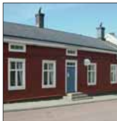
Bagarstugan Café & Vin Ekonomiegatan 2 Mariehamn