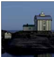
Kobba Klintar Mariehamn