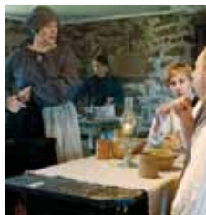
Pellas ladugård Skepparvägen 30 Granboda Lemland