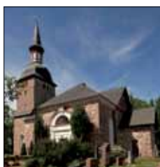
Jomala kyrka Godbyvägen 445 Jomala