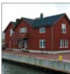
Salt Sjö kvarteret Mariehamn