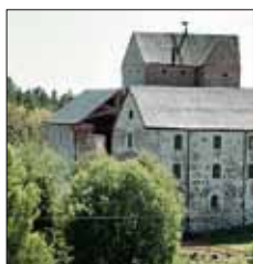
Kastelholm slott Kungsgårdsallén 5 Kastelholm Sund