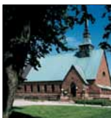
S:t Görans kyrka Ö. Esplanadgatan 6 Mariehamn