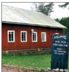
Pub Stallhagen Getavägen 196 Godby Finström