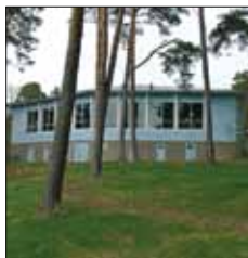
Badhuspaviljongen Badhusparken Mariehamn