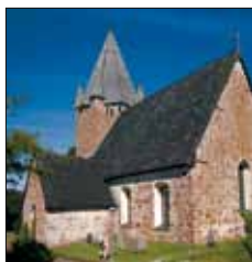
Finströms kyrka Pålsbölevägen Finström