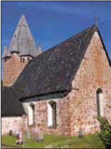
Finströms kyrka Pälsbölevägen Finström