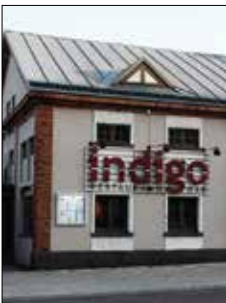
Indigo bar Nygatan 1 Mariehamn