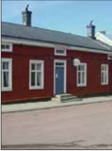
Bagarstugan Café & Vin Ekonomiegatan 2 Mariehamn