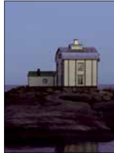
Kobba klintar Mariehamn