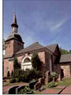
Jomala kyrka Godbyvägen 445 Jomala