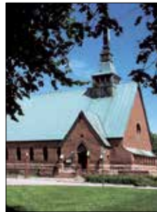
S:t Görans kyrka Ö. Esplanadgatan 6 Mariehamn