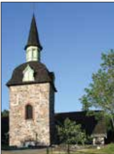
Föglö kyrka Kyrkvägen 106 Föglö