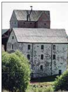
Kastelholms slott Kungsgårdsallén 5 Sund