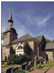
Jomala kyrka Godbyvägen 445 Jomala