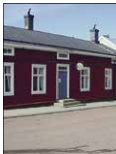
Bagarstugan Café & Vin Ekonomiegatan 2 Mariehamn