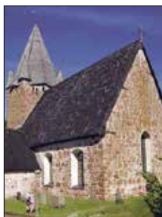
Finströms kyrka Pålsbölevägen Finström