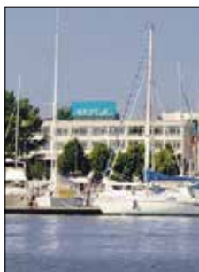
Oliven restaurang & bar Hotell Arkipelag Strandgatan 35 Mariehamn