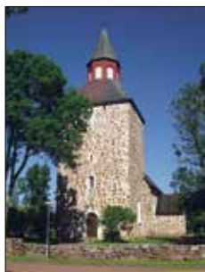
Saltviks kyrka Kvarnbo Saltvik