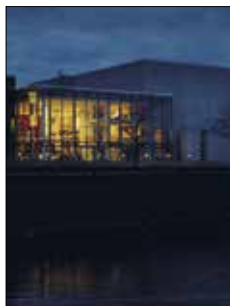
Alandica kultur och kongress Strandgatan 33 Mariehamn