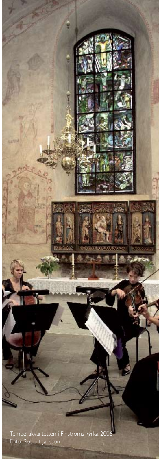
Temperakvartetten i Finströms kyrka 2006.