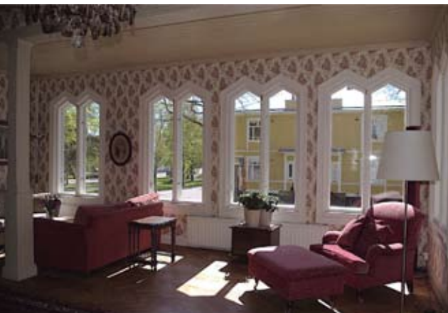
Norragatan 24, Mariehamn.