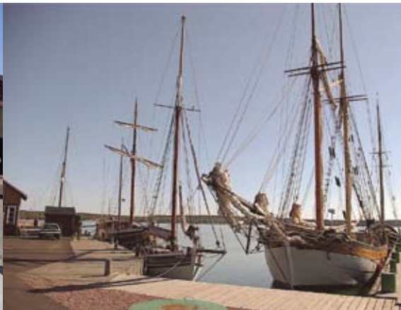
Sjökvarteret i Mariehamn.

A Young Sprout har arrangerats av den kubanske tonsättaren och gitarristen Leo Brouwer.