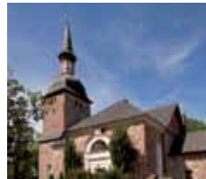
St Olofs kyrka Prästgårdenby Jomala