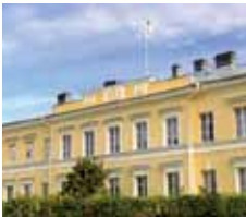
Eckerö Post- och tullhus Eckerö