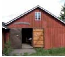
Skärgårdsmuseet Lappo Brändö