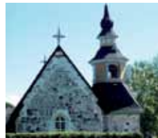
Sta Anna kyrka Kumlinge