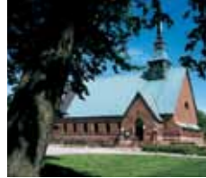
St Görans kyrka Ö. Esplanadgatan 6 Mariehamn