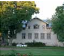
Kvarnbo gästhem Kyrkvägen 48 Kvarnbo Saltvik