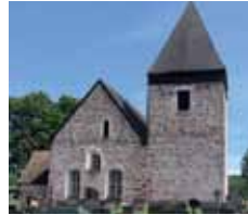
Sta Catharina kyrka Prästgårdsgatan 41 Hammarland