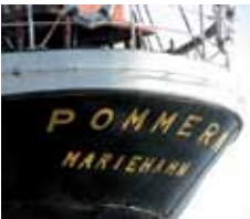
Museifartyget Pommern Västra hamnen Mariehamn