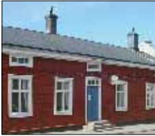
Bagarstugan Café & Vin Ekonomiegatan 2 Mariehamn