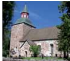
Sta Maria kyrka Kyrkvägen 42 Kvarnbo Saltvik