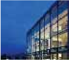
Alandica kultur & kongress Strandgatan 29 Mariehamn