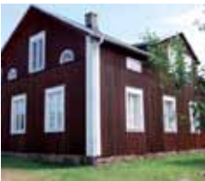
Hembygdsgården Erkas Värdö