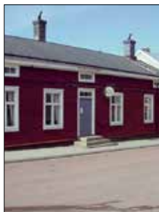
Bagarstugan Café & Vin Ekonomiegatan 2 Mariehamn