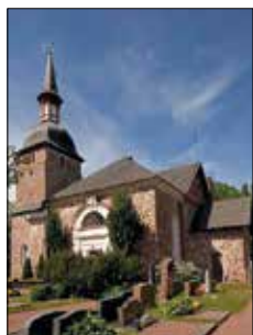
Jomala kyrka Godbyvägen 445 Jomala