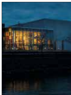
Alandica kultur och kongress Strandgatan 33 Mariehamn