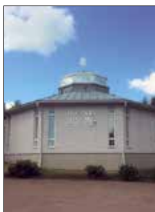
Ålands musikinstitut Grindmattesvägen 7 Mariehamn