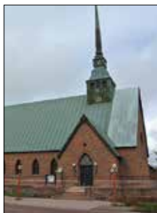
S:t Görans kyrka Ö. Esplanadgatan 6 Mariehamn