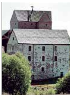
Kastelholms slott Kungsgårdsallén 5 Sund