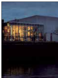
Alandica kultur och kongress Strandgatan 33 Mariehamn