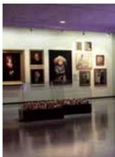
Ålands konstmuseum Storagatan 1 Mariehamn