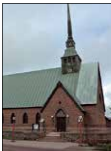
S:t Görans kyrka Ö. Esplanadgatan 6 Mariehamn