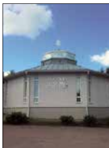
Ålands musikinstitut Grindmattesvägen 7 Mariehamn