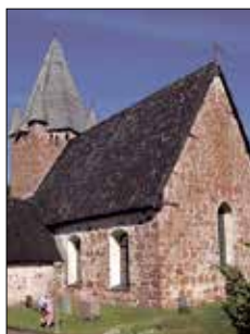
Finströms kyrka Pålsbölevägen Finström