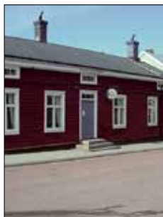
Bagarstugan Café & Vin Ekonomiegatan 2 Mariehamn