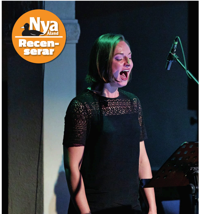
"Instrumenteringen och röst användningen hos den (delvis?) improviserade sången är dynamisk och varierad", skriver när verket framfördes i Berlin i slutet av augusti.

Det centrala blir naturligtvis främst den musikaliska upp-