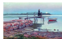
Elin Danielson-Gambogis "Bryggan", ett motiv från Önningeby.

I ansökan beskrivs filmen som "en blandning mellan dokumentär och en historisk film", med syftet att väcka en