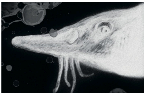
Stören är en av de arter som gestaltas i verket. Den utrotades i Östersjön på 1900-talet.