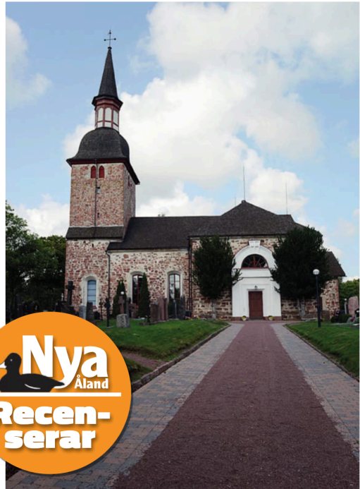
Konserten i Jomala kyrka var tredelad.

När man hör den här musiken dyker funderingar upp om dröm, det undermedvetna och det absurda – Freud, Salvador Dalí, Paul Klee (med sina till synes löjliga barnteckningar som egentligen bär på djupa existentiella grubblerier). Det är heller ingen tillfällighet att Schönberg inte har preciserat för vilken typ av röst rollen ska gestaltas, men den brukar framföras av en klassiskt skolad sopran, men, det går