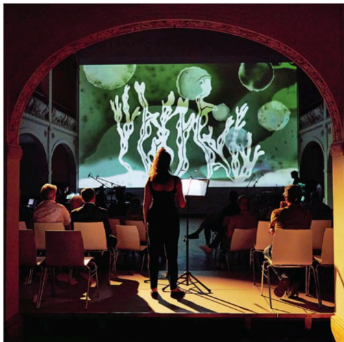
Från ett framförande av "Baltic Songlines" i Berlin.